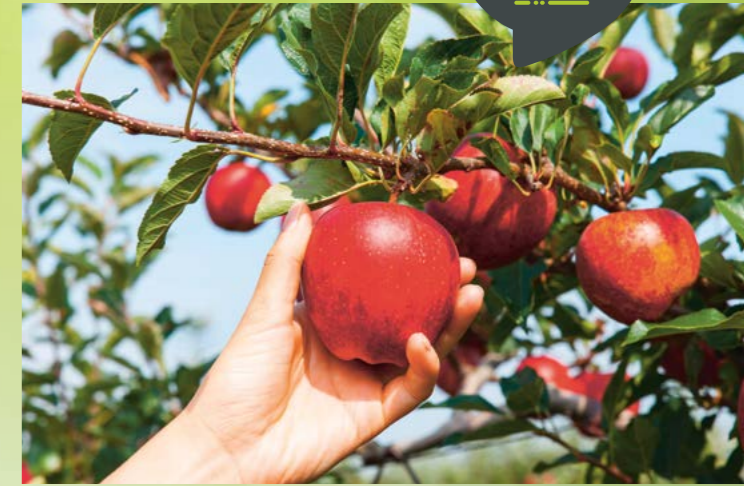
Obstgenuss gratis: An speziell gekennzeichneten Bäumen ist das Ernten der Früchte für den Eigenbedarf ausdrücklich erwünscht.