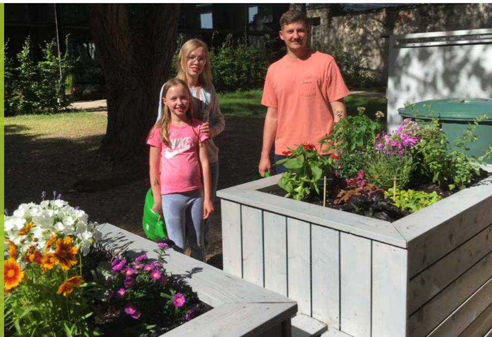
Gelebte Nachbarschaftshilfe: Die gemeinsame Bepflanzung der beiden Hochbeete machte allen Beteiligten viel Spaß und man kam schnell ins Gespräch.

Wenn man es genauer betrachtet: Zuerst kamen die Häuser, dann die Nachbarn